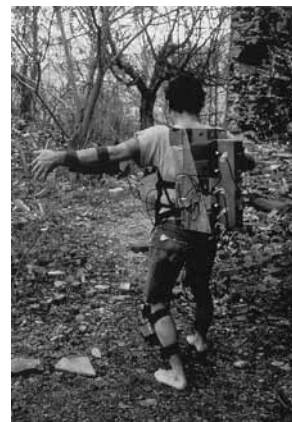
FIGURA V POHYBU (gesto / tanec / hlas) – BIOLOGICKÝ RYTMUS