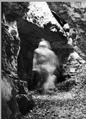
Být či nebýt

PERFORMER jedná sám za sebe, ze sebe tvoří a představuje svoji vlastní roli, v dané situaci nese kůži na trh, bezprostředně se angažuje i v sociálních vztazích a za své jednání je plně sám zodpovědný. Přímo zasahuje do reality dění (v skutku uskutečňuje skutečnost), nepotřebuje vytvářet iluze, popisovat, vyprávět příběhy, ale reálnou akcí modeluje situace a děje