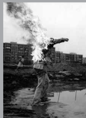
8 8 88