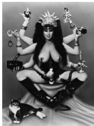
Sprinkle: Post-Porn Modern