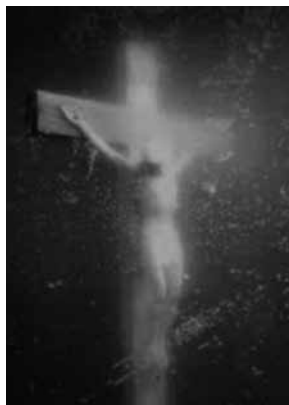
Serrano: Piss Christ

Yes Men, The True Story of the End of the WTO, Disinformation Company – NY