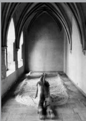
Prášení na konci chodby