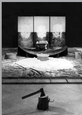
Ve třech dnech