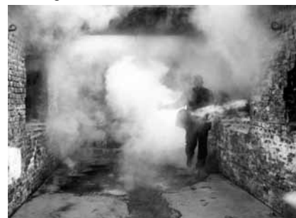
Rtuť a sira