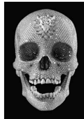
Hirst: For the Love of God