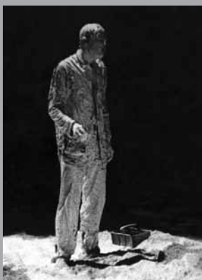
S kůží na trh

PERFORMANCE je tedy ta (základní) část herectví , kdy skutečná osobnost předstupuje před diváka/publikum a v reálném čase na skutečném místě přirozeně rozvíjí situaci – „scénu“.