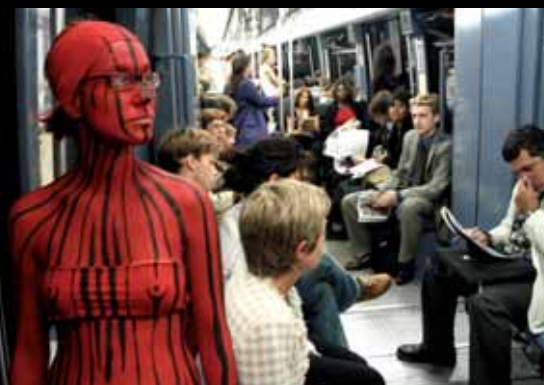
Pavla Kislerová, Maluj mne, 2006, portfolio